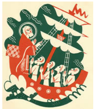
圣人的纪念日是12月6日。

作品中最为普遍。在东方，尼古老是海员的主保。在西方，尼古老是儿童的主保。尼古老为海员主保圣人，来历是这样的：有一艘船在吕西亚海岸遇险，船员呼求尼古老援助，圣人显现，援救他们脱了险。爱琴海和约尼海的船，启锚出发时，海员都用“愿圣尼古老把好船舵”一语，互祝旅途平安。此外，由于圣尼古老生前曾救助过三名死囚，所以他也是囚犯和俘虏的主保圣人。